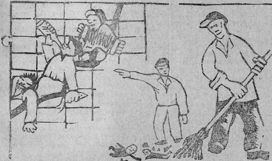
Сметай железная— Партийная метла: